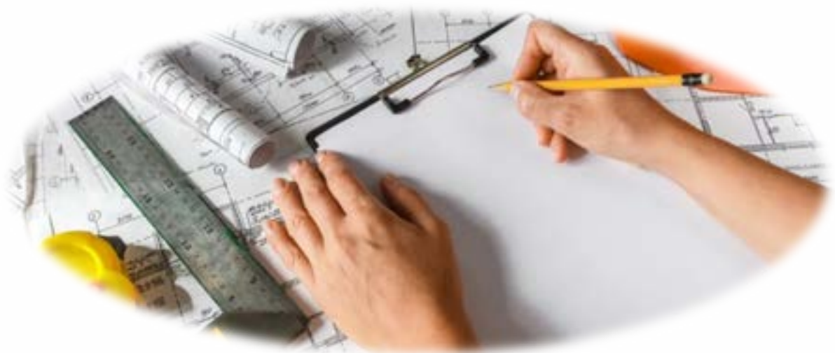
Afbeelding: effectiviteit wordt vergroot door vroeg met elkaar in gesprek te gaan.

In het overleg met de gemeente is steeds duidelijker te zien dat het Sociaal Domein een geheel is waarvan de delen, Wmo, Jeugdhulp en Participatiewet, een samenhangend en integraal beleid vergen bij de zorg en ondersteuning aan kwetsbare burgers.