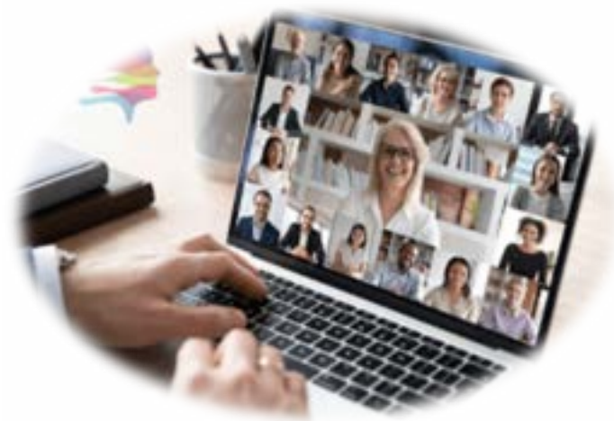
Afbeelding: digitaal vergaderen.

Per 1 januari 2019 is de Participatieraad gaan werken in de Cloud voor het gebruik van agenda, notulen, vergaderstukken en archief. In 2020 is het werken in de Cloud voortgezet en vinden de overleggen digitaal plaats via Zoom. Dit digitaal ook wel genoemd op afstand samenwerken was in 2020 niet alleen noodzakelijk door de maatregelen rondom Covid-19 maar heeft ook geleid tot het efficiënter vergaderen en de mogelijkheid om eenvoudiger als Participatiedenker deel te nemen aan de diverse overleggen.