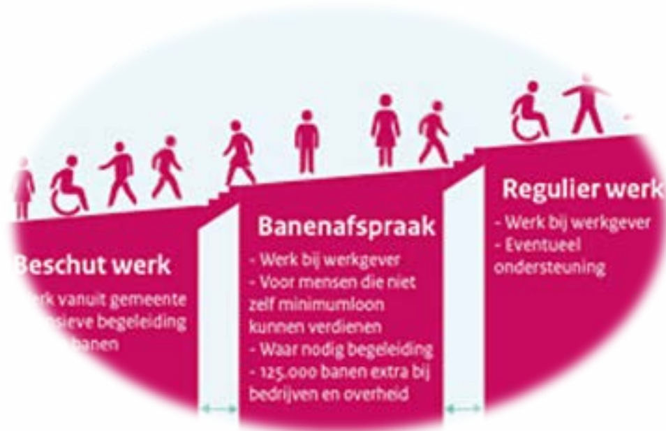
Afbeelding: voorbeeld van stappen/mogelijkheden arbeidsparticipatie

Een andere vorm van regionale samenwerking is de Regionale Adviesraad Werk en Participatie (RAWP), die nu 5 jaar bestaat. De raad bestaat uit vertegenwoordigers van lokale adviesraden, cliëntenraden, UWV en FNV. Onze voorzitter is ook voorzitter van deze raad. De focus ligt op werkgelegenheid voor mensen die om enige reden een afstand tot de arbeidsmarkt hebben. Dit naar aanleiding van een convenant dat de Rijksoverheid met gemeenten gesloten heeft om in 2026 landelijk 125.000 banen te creëren voor deze doelgroep. De RAWP hoopt daar een bijdrage aan te kunnen leveren. De RAWP houdt zich niet bezig met de Participatiewet.