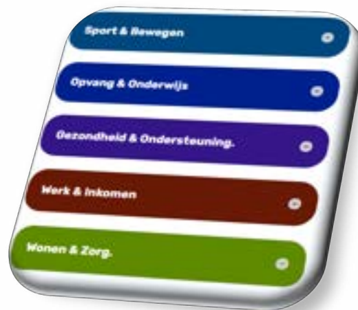
Abbeelding: voorbeelden adviesterreinen Sociaal Domein.

De participatieraad adviseert aan het college van B & W over alle maatschappelijke beleidszaken binnen het sociaal domein: