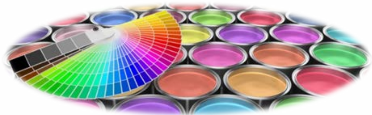
Afbeelding: de diversiteit binnen het sociaal domein.